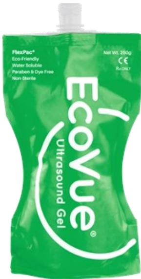
285 - 250 g FlexPac®