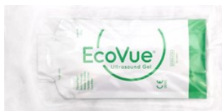
280 - 20 g steril / SafeWrap® 282 - 32 g steril / SafeWrap®