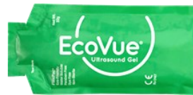
281 - 20 g ikke-steril 283 - 32 g ikke-steril