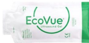
280NW - 20 g steril 282NW - 32 g steril